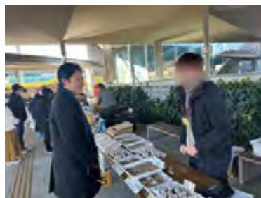
甲斐市甲斐てき朝市で参加者の皆さんと交流