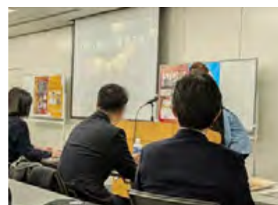
韮崎市で行われた依存症セミナーで当事者のお話を聴く

国民の生活を脅かす凶悪犯罪の抑止のためにも、依存症対策は極めて重要です。国として抜本的な対策強化を求めました。