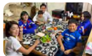
4人の子どもの父親です！