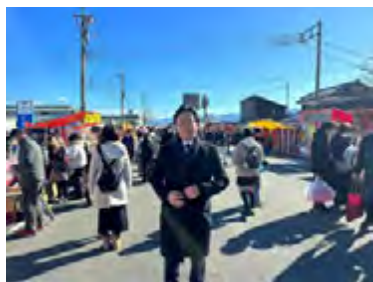
南アルプス市十日市で来場者の皆さんと交流