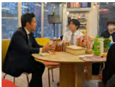
甲府市で高校生や若い世代の方々と意見交換

地域の皆様のお声を届けることが政治家の仕事です。日頃から、県内各地様々なイベントなどへ伺い、皆様との交流の中でお声を聴くことを大切にしています。