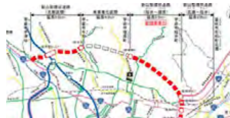
新山梨環状道路北部区間計画