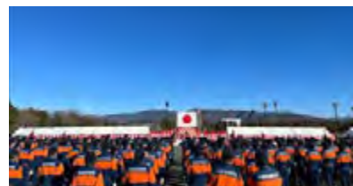
甲府市消防団出初式に出席