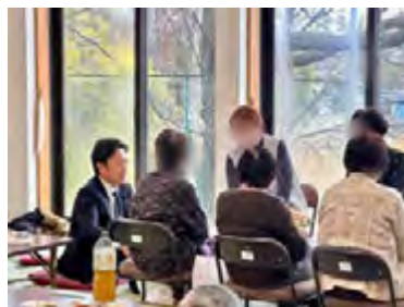
韮崎市三ツ沢地区の春祭りで皆さんと交流