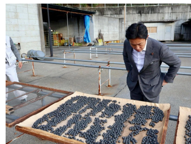
市川三郷町の花火メーカーさんで伝統産業を視察