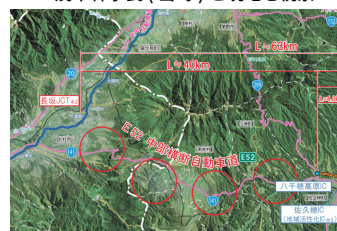
中部横断道北部区間の図（国土省 HP より）