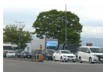
渋滞する20号線