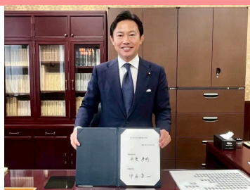
新旧副大臣の引継ぎに署名