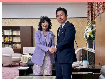
片山さつき財務大臣へご挨拶