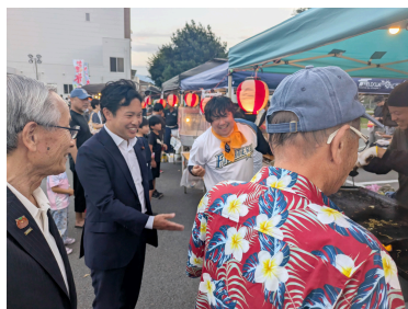
甲斐市中八幡ふるさと祭りに伺い、皆さんと交流