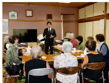
南アルプス市戸田地区の女性の会で国政報告