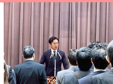
就任挨拶式で財務省幹部へご挨拶