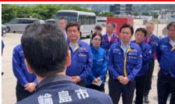
能登半島地震の現場を視察