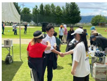
甲斐市で地域の運動会 に伺い、皆さんと交流