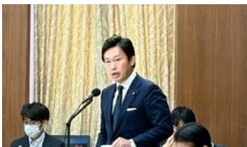
価格適正化について委員会で質問