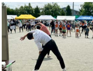
甲府市で地域の運動会 に伺い、皆さんと交流