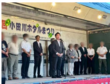
韮崎市小田川ホテル まつりに伺い、ご挨拶