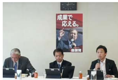
党のリニア特別委員会事務局長 として早期整備を推進

リニア中央新幹線の早期開通を実現して、山梨を躍進させるためには、着工が遅れている静岡工区の早期着工が不可欠です。国が主導して事業のスケジュール感を出さなければ、沿線への投資も進まず、地元経済への恩恵もおりてきません。国土交通省に対して、さらなる働きかけを進めるよう提言し、一刻も早い静岡工区の着工を求めました。