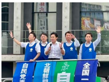
自民党青年部・青年局 の仲間と街頭活動

地域の皆さんのお声を届けることが政治家の仕事です。日頃から、県内各地様々なイベントなどへ伺い、皆様との交流の中でお声を聴くことを大切にしています。