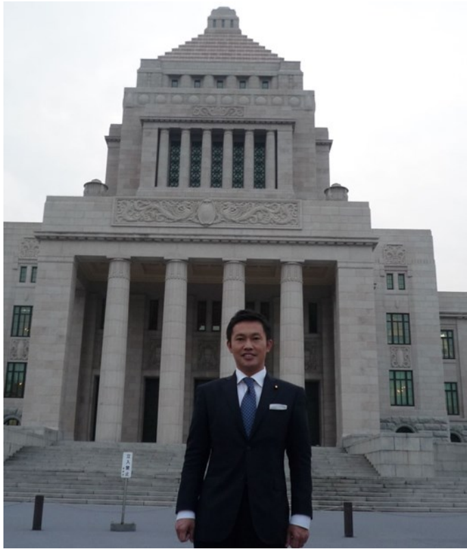
2015年1月26日国会召集日にて